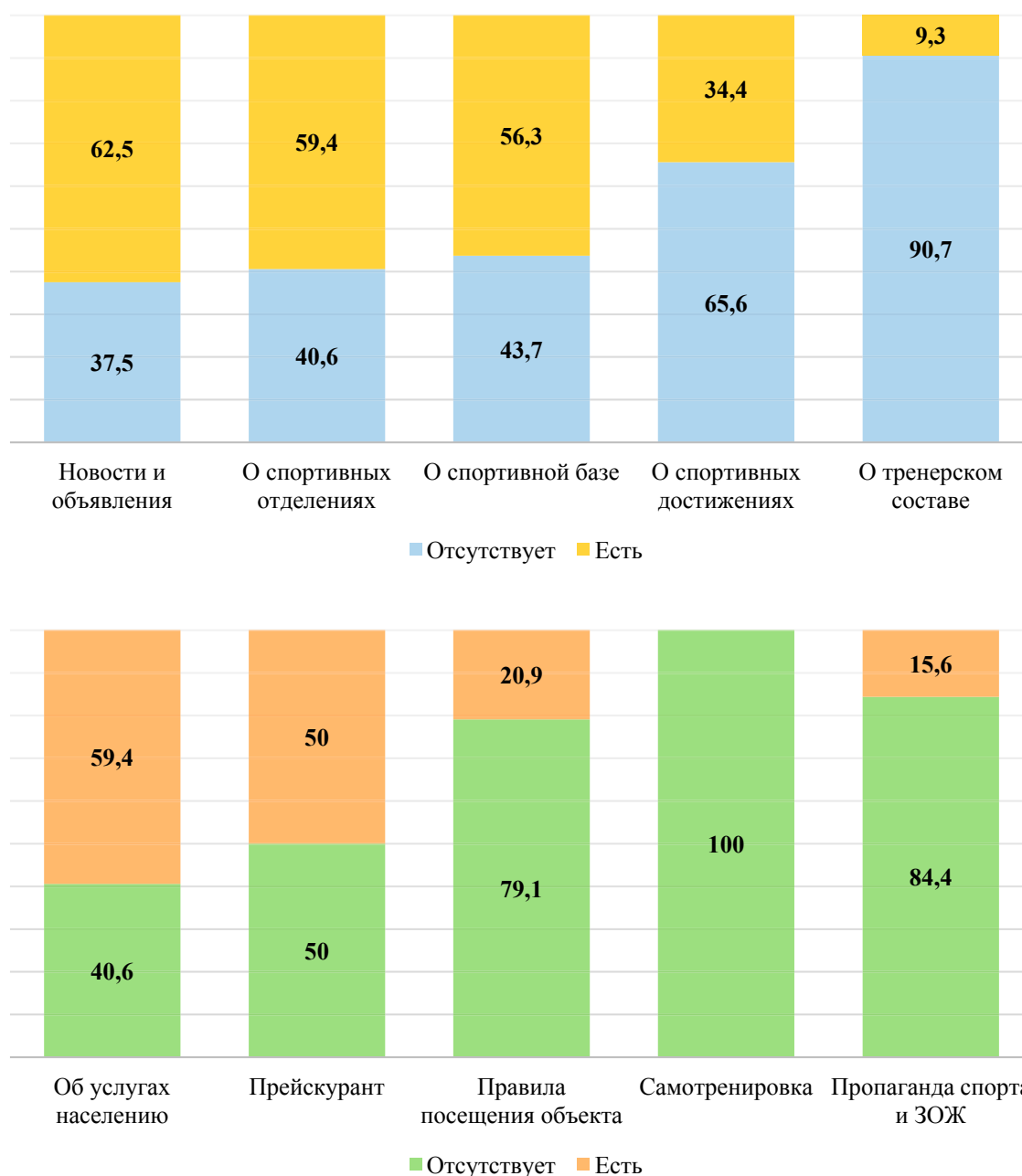
Рисунок 2 — Наличие информации на сайтах спортивных учреждений, %

Спортивным учреждениям необходим пересмотр коммуникационной политики в пользу организации системной работы с группами общественности, в том числе в информационном пространстве. Реализация коммуникационного менеджмента должна осуществляться специалистами, обладающими профессиональными компетенциями в области ведения коммуникаций. Информационные ресурсы спортивных учреждений призваны нести в себе следующие функции: